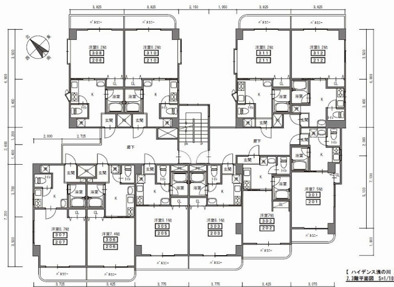
【ハイデンス浅の川】 2.3階平面図 S=1/100